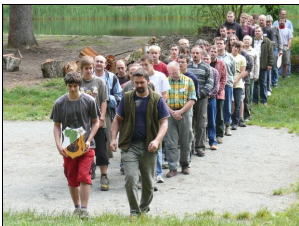
Otec a syn