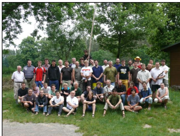
Společné foto účastníků víkendu