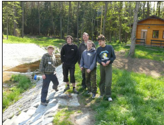
Synovské skupinky spolu