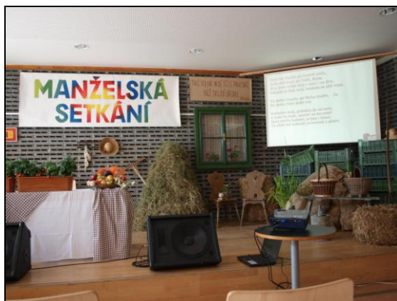
Stylová výzdoba sálu