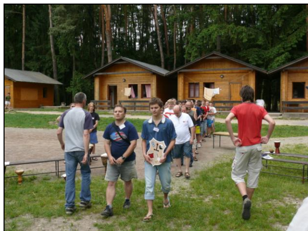
Společně přinášíme rodinné erby